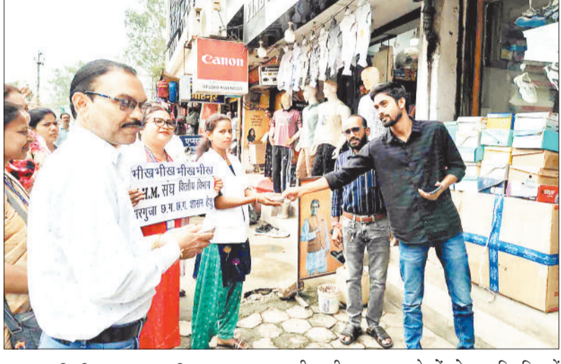
हरिभूमि न्यूज ►► अंबिकापुर

अपनी मांगों को लेकर अनिश्चितकालीन हड़ताल पर बैठे एनएचएम के कर्मचारियों ने शुक्रवार को अनोखा प्रदर्शन किया। एनएचएम के चिकित्सा, नर्सिंग स्टाफ व अन्य कर्मचारी हाथ में कोटरा लेकर सड़क पर निकले और भीख मांगा। संघ ने शहर के दुकानों, ठेले गुमटियों से भीख मांगकर अपना विरोध जताया। इतना ही नहीं कर्मचारी इस राशि को शासन के कोष में जमा कराएंगे ताकि शासन उन्हें नियमितीकरण का उपहार प्रदान करे।