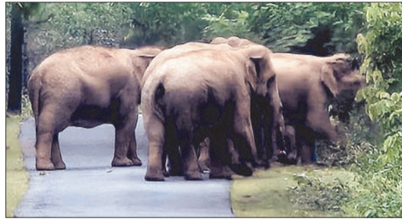
विचरण करते हाथी।

उल्लेखनीय है कि बीते दिनों एमसीबी जिले के बिहारपुर वन परिक्षेत्र के ग्राम गरूडडोल से होते हुए 12 सदस्यीय हाथियों का दल अमृतधारा होते कोरिया जिले में प्रवेश किया। वहीं वनमंडल मनेन्द्रगढ़ के वनपरिक्षेत्र कोटाडोल अंतर्गत ग्राम बधेल बीट घटमा कक्ष क्रमांक पी-106 में शुक्रवार देर रात लगभग 2:15 बजे हाथी के विचरण की सूचना शेष पेज 4 पर