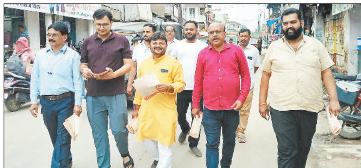
शहर में निकले चेंबर के लोग।