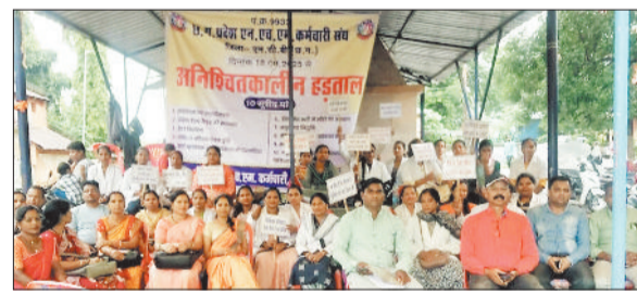
अनिश्चितकालीन हड़ताल पर बैठे स्वास्थ्य कर्मी।

छग प्रदेश एनएचएम कर्मचारी संघ (पंजीयन क्रमांक 9353) के आह्वान पर प्रदेशभर के स्वास्थ्य कर्मी 18 अगस्त से अनिश्चितकालीन हड़ताल पर हैं। बीते दो दशकों से संविदा व्यवस्था में कार्यरत इन कर्मचारियों का कहना है कि वे समान पद पर समान कार्य करने के बावजूद निर्धारित कर्मचारियों जैसी सुविधाओं और वेतनमान से वंचित हैं। भारी बरसात और कठिन परिस्थितियों के बावजूद कर्मचारी आंदोलन जारी रखे हुए हैं। जिला मनेन्द्रगढ़-चिरमिरी-भरतपुर इकाई के कर्मचारी काफी संख्या में धरना