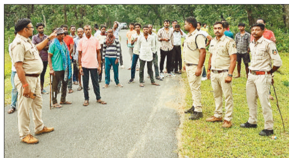
निगरानी करता वन अमला।